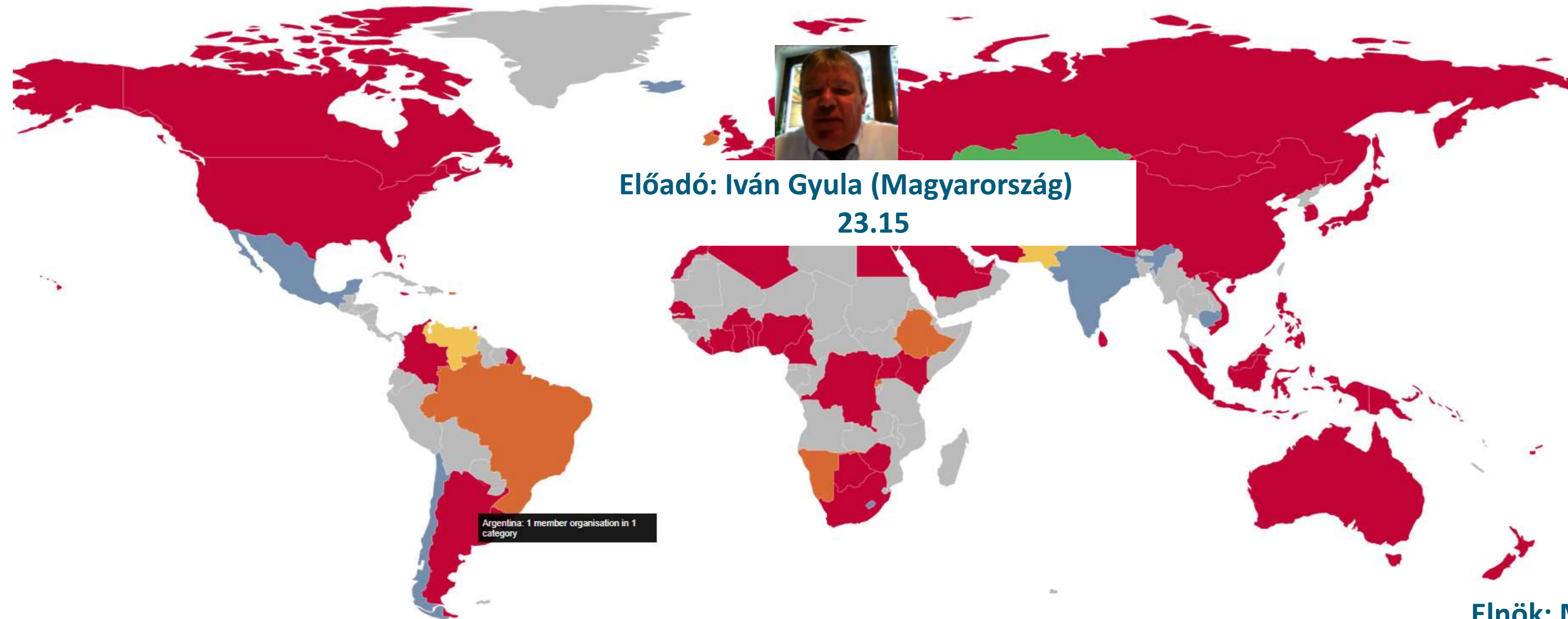
FIG Member Associations 2021